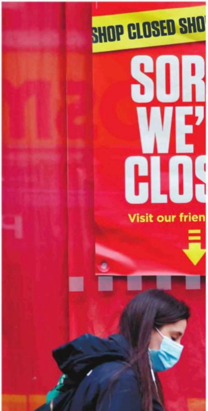
המשבר ייגמר וזה מבכיר את הקושי הנפשי"

היותה לא כל בעיה חברתית בעבר אמרה ליה 'כבר' הרגלתי לא לפגוש חברים'. "יש גם שנאה וקיסוב באוויר. יש לי מטופלים שגרבו בקורונה רהבניס' אנשים לבירוד – זה יוצר בעיניים, רגסי אסם והאשמות. לפעמים אני שים לא מוכנים לפגוש אותם כשהם יוצאים מה' בירוד'. לרבריה, אם הגעת בתקופה הזאת לטקום יצד משהו לפחד ממנו. ככל שאהה יותר מוחלש מלכתחילה המכה היא גדולה יותר, אבל המכה כל כך חזקה ומטומטמת שהיא גם מערערת את המרכז".